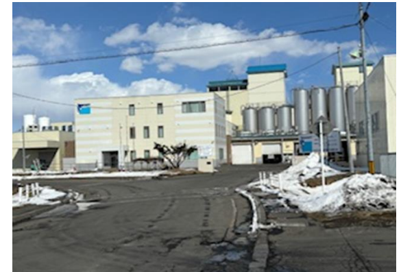
タカシ乳業 北海道 釧路工場