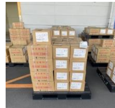
（改善後の保管状況）

○全ての業務を九州西濃運輸の福岡西物流センターが 窓口となり一本化を実現 （入庫～保管～仕分～出庫～配送）