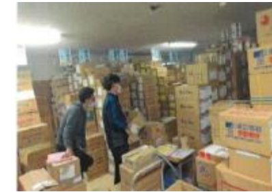
荷主様事務所内：煩雑な保管状態