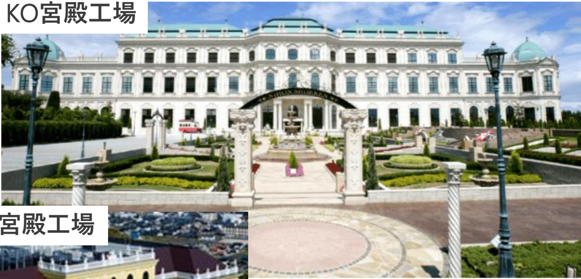
シェーンブルン宮殿工場