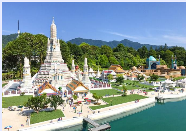
東武ワールドスクウェア