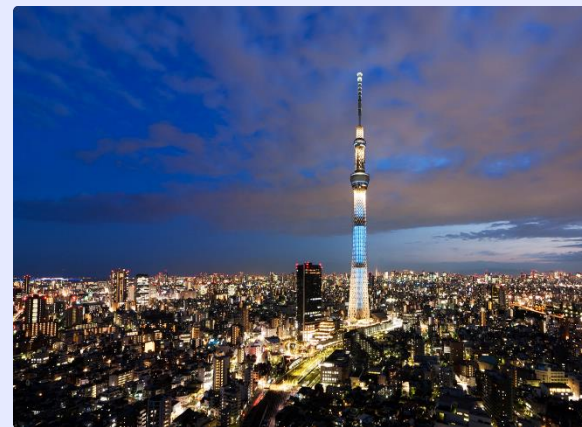
東京スカイツリー