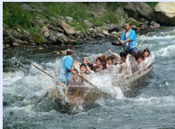
鬼怒川ラインくだり